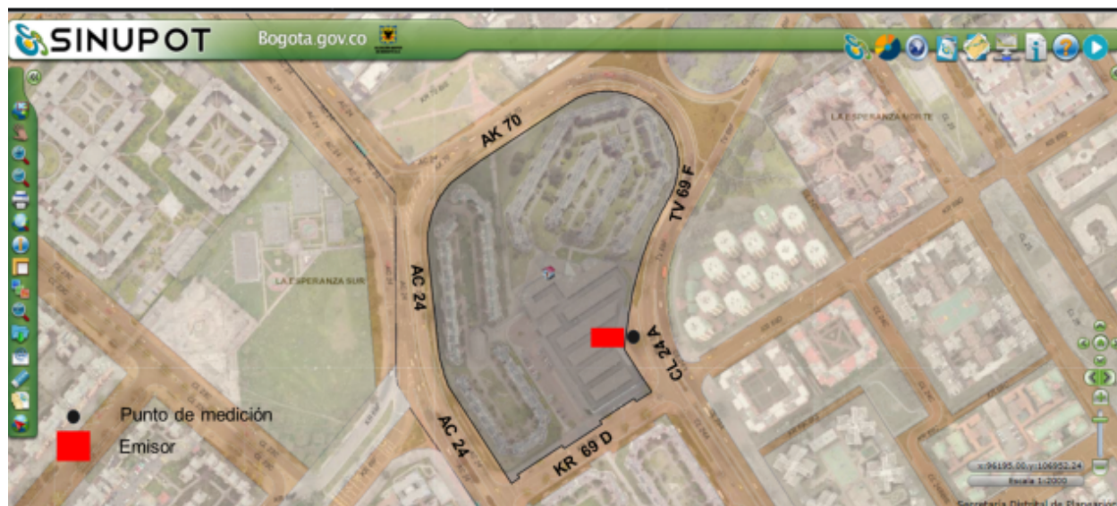
Figura 1. Ubicación del predio emisor y punto de medición.